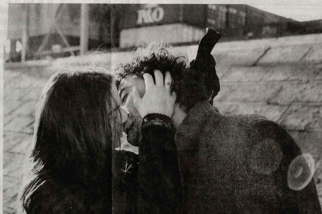
Liebe statt Geld: Alex verlässt den Freund und bündelt mit einem Clown an.

Inmitten allen Ehrgeizes entwickelt Alex Skepsis gegen den Geschäftsmann Gottfried